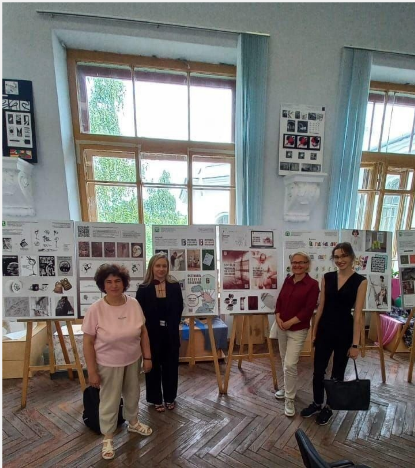
Поздравляем наших выпускников с успешными защитами!