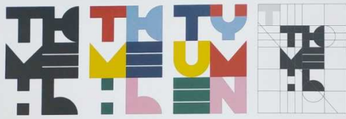
Разработка фирменного блока