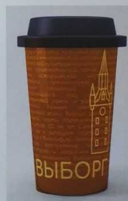
Разработка сувенирной продукции