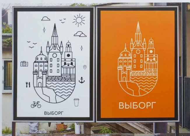
Плакат в среде