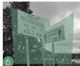
6 Отсутствует читаемая навигация