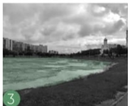
3 Зоны подтопления территории