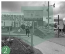
2 Отсутствует основная входная группа