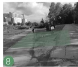
8 Дорожно-тропиночная сеть непродумана