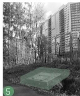
5 Технические люки