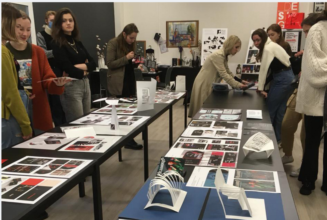
Обход по дисциплине Дизайн-проектирование