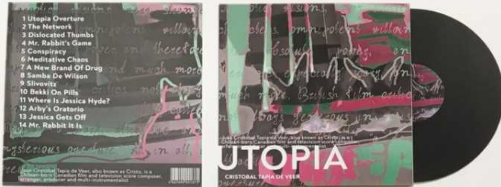
обложка для пластинки