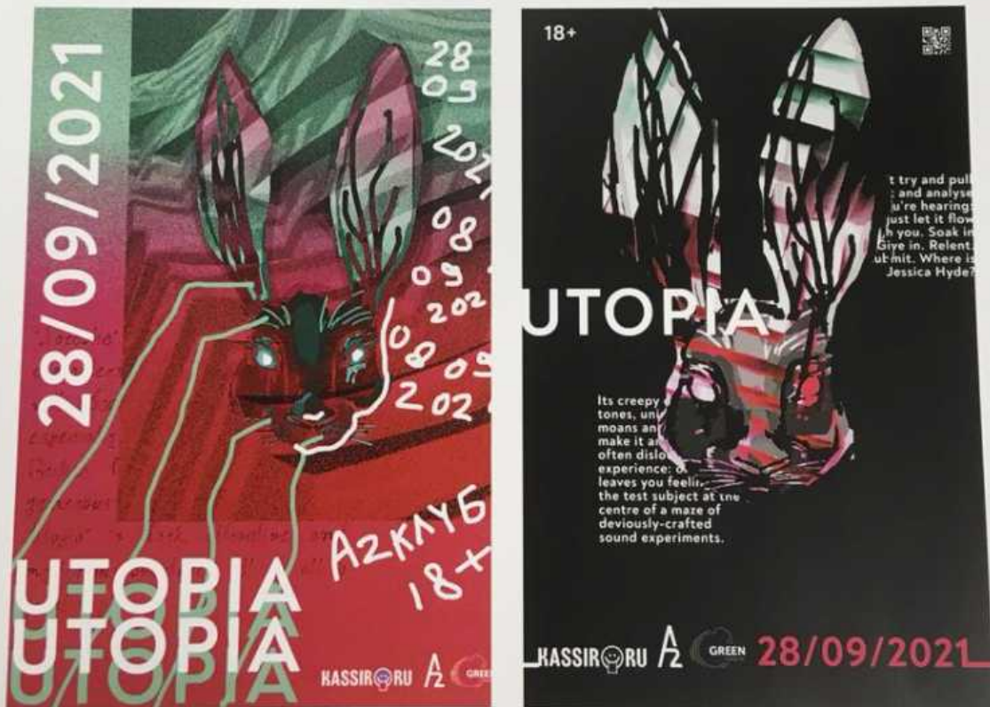
афиша для концерта