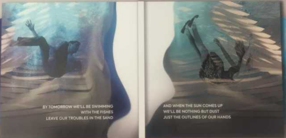
Внутренняя сторона (разворот альбома)