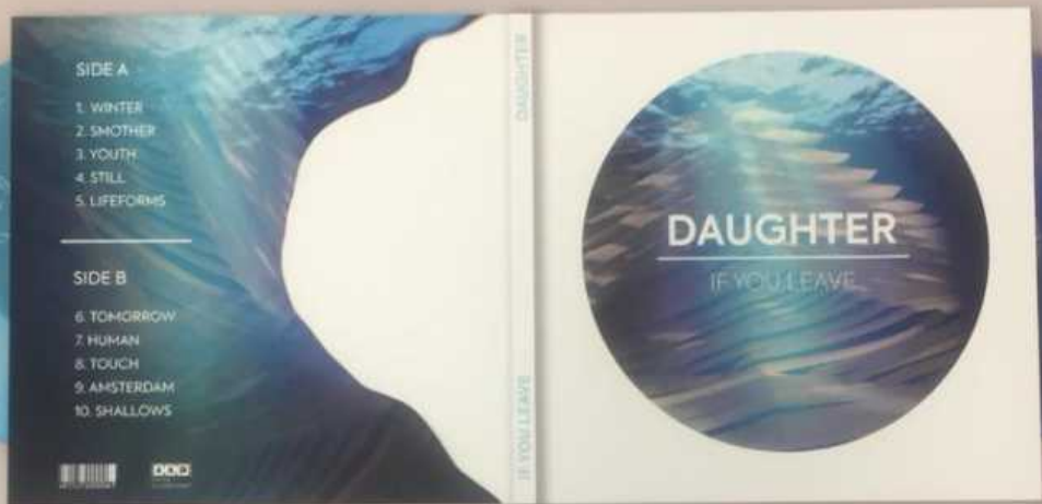
Лицевая сторона альбома