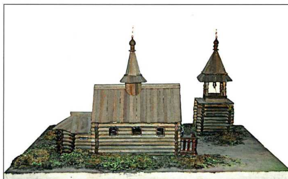
Макет первой деревянной церкви

Южный придел был пристроен значительно позднее для служения ранних литургий, прочих поминовений и других отправления культа». Об этом сообщают нам архивные документы – дело, хранящееся в синодальном архиве за 1725 год под номером 352 [31]. Южный придел был освящен во имя Архистратига Михаила и прочих бесплотных сил 8 ноября