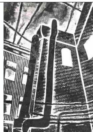
#13 Горова Е.Е. Пенза