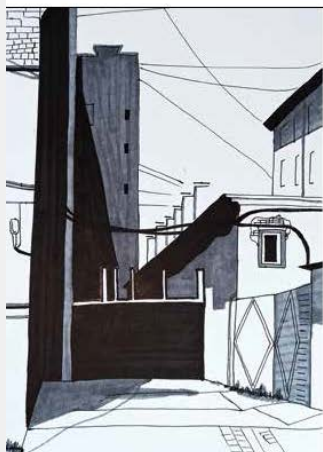
#10 Савезн М.А. Зарисовка петербургского двора