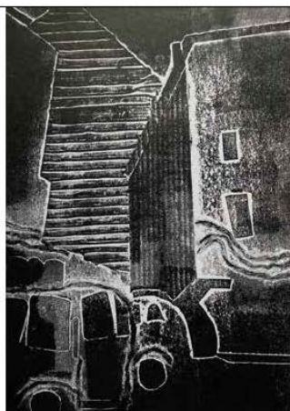
#12 Олексиная С.А. Иллюстрация в технике трафаретной печати